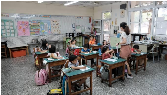
說明：學生發表想法