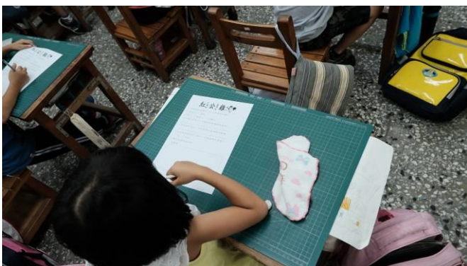
說明：學生撰寫學習單