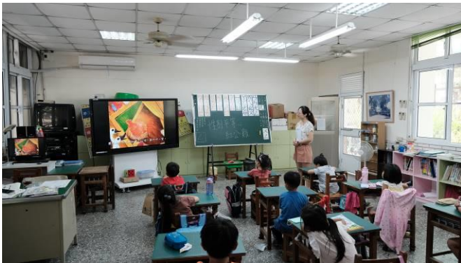
說明：閱讀「紅公雞」繪本