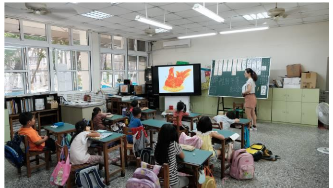
說明：討論繪本內容