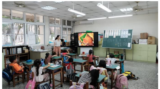
說明：教師統整性別平等觀念