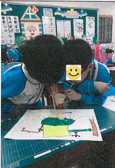
利用彩色泡泡水作畫