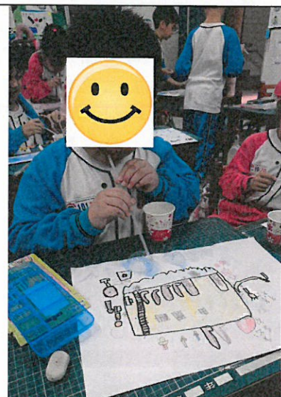
利用彩色泡泡水作畫