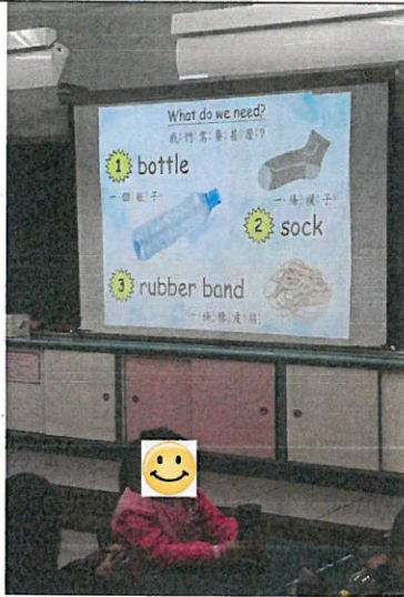
泡泡工具製作說明