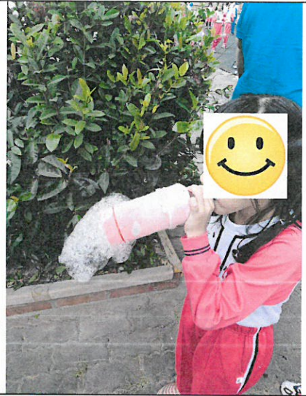
利用自製的吹泡泡工具吹泡泡