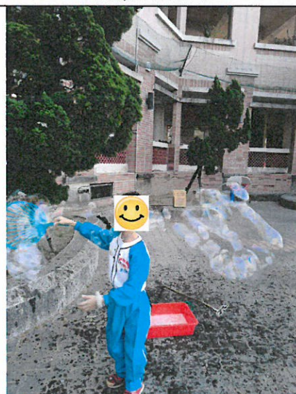
利用自製的吹泡泡工具吹泡泡