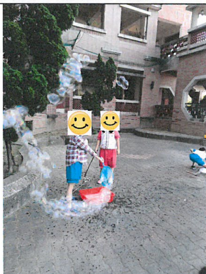
利用自製的吹泡泡工具吹泡泡