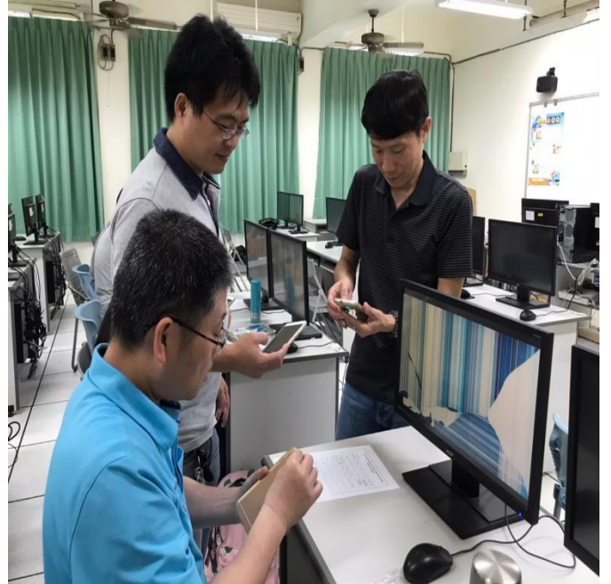
相片說明：自走車SCRATCH程式