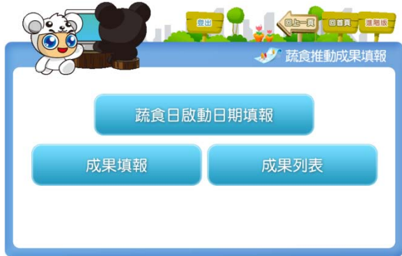
「卡通版100年度水電號登錄及地方評比」填報系統