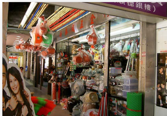
一般商家(環保標章商品)