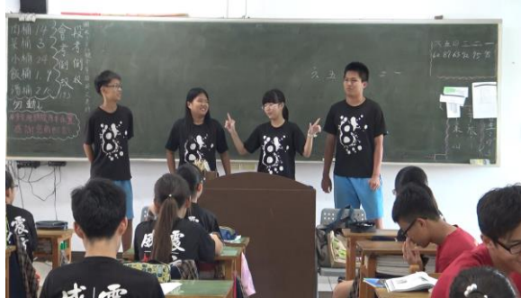
這組提到夏林路的客家文化會館的客家點心