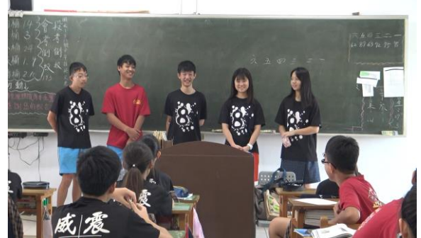
這組同學介紹安平老街的蝦捲