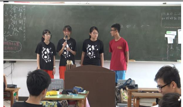
這組同學約好寒假騎腳踏車去安平老街