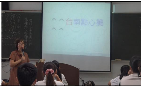
老師用閩南語介紹台南的點心攤