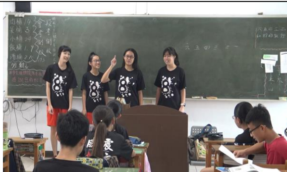
這組同學介紹棺材板的特色