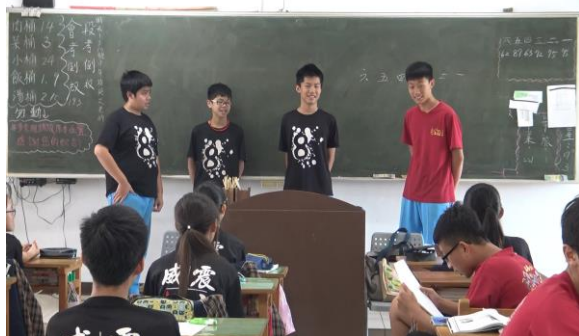
這組同學介紹安平老街的蚵仔煎