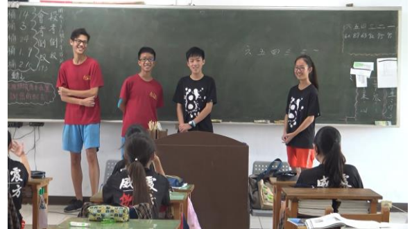
這組同學聊到搭公車去安平老街的過程