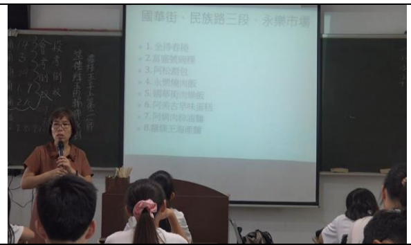
老師用閩南語介紹台南的美食聚落