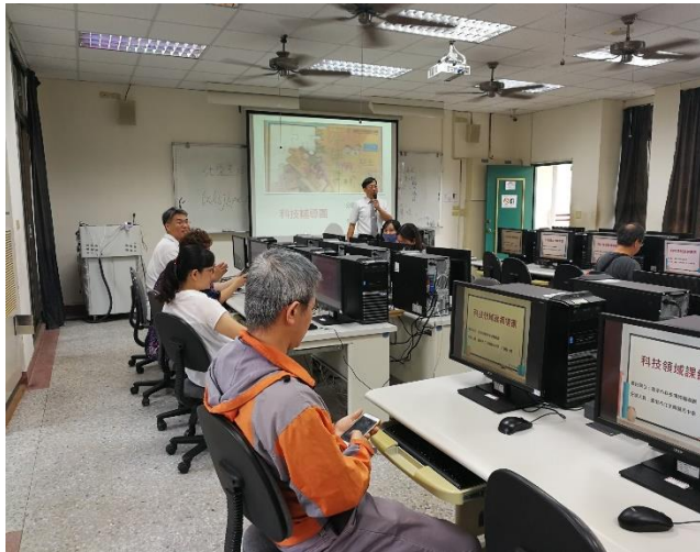
相片說明：課程內容2