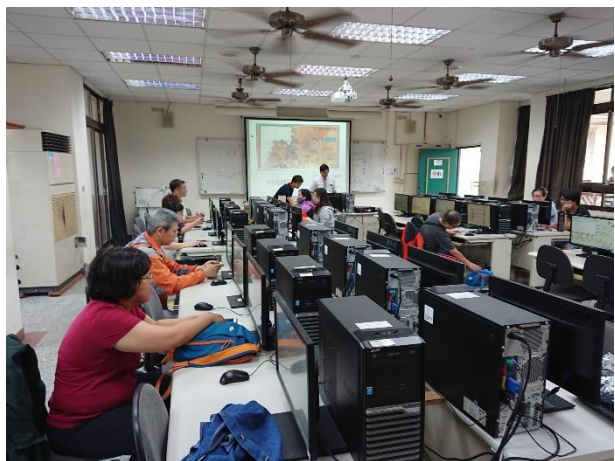
相片說明：課程內容3