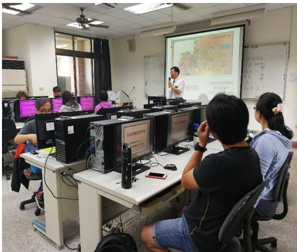
相片說明：課程內容1