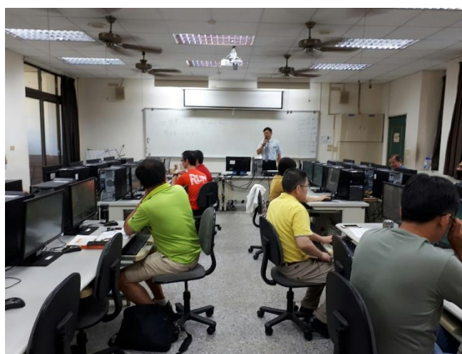
相片說明：課程內容1