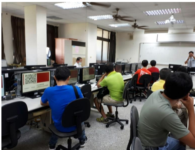
相片說明：課程內容2