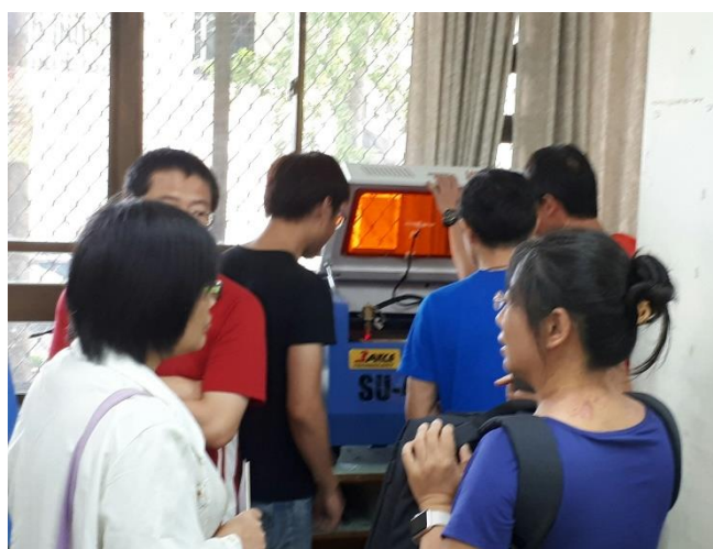
相片說明：課程內容3