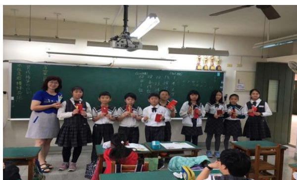
開心領紅包-分兩批合照