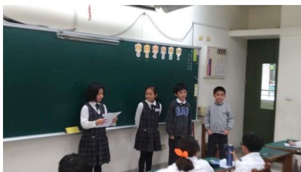
過年習俗大不同(小組發表)