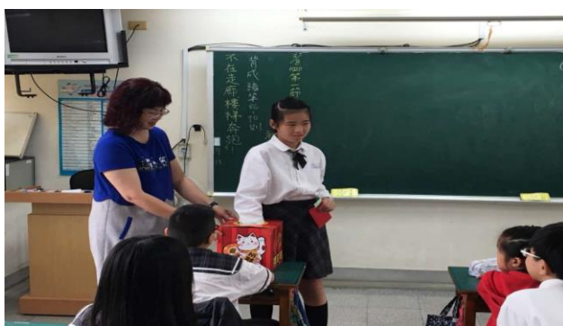
完成全部任務的人--抽紅包