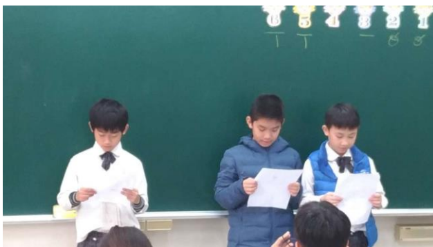
過年習俗大不同(小組發表)