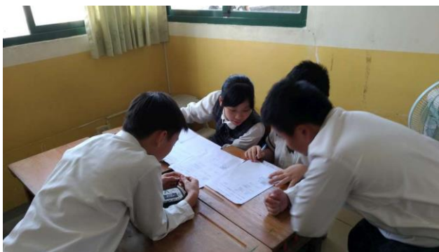
小組討論(過年習俗)