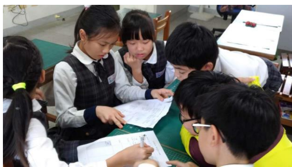
小組討論(過年習俗)