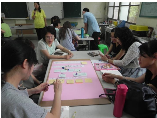
分組討論建立共識