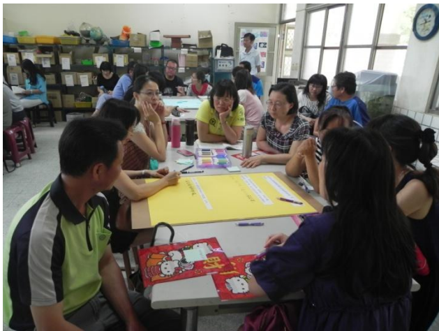
學員參與課程進行