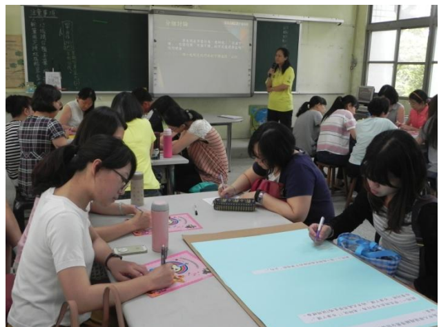
分組討論建立共識