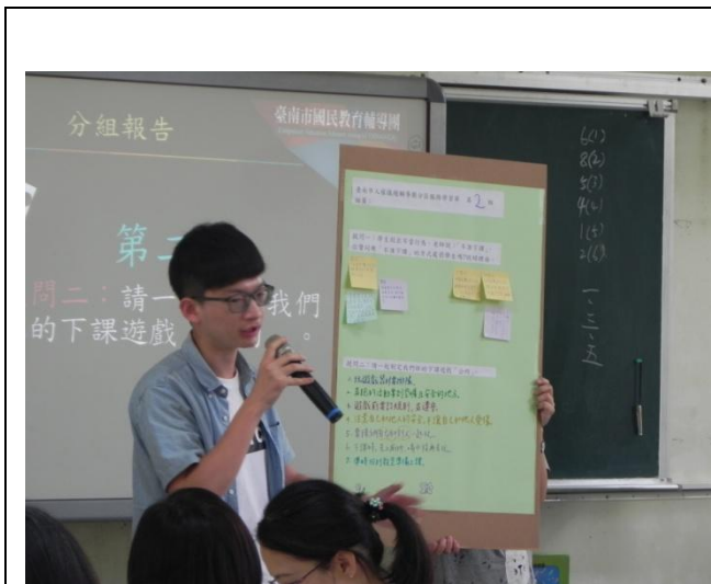
分組討論進行發表