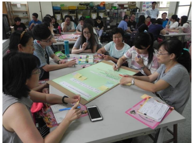
分組討論建立共識