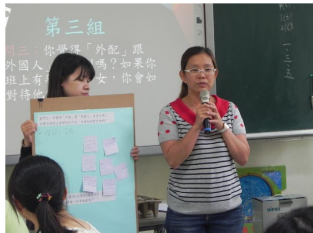
分組討論進行發表