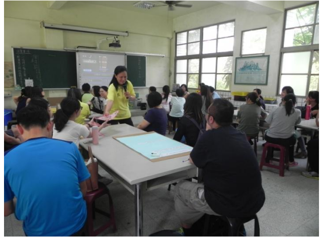
慧珍老師以故事帶領大家認識分配正義