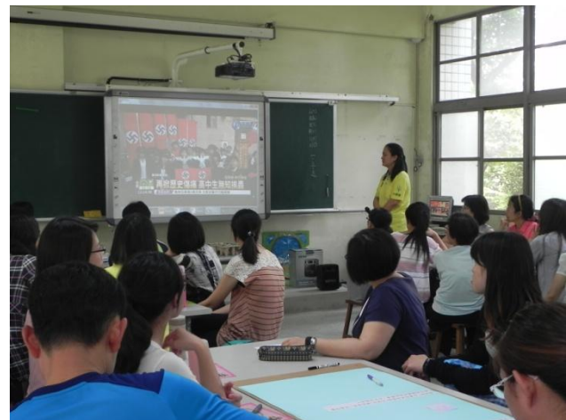
慧珍老師進行結論，並利用新聞事件作為延伸課程