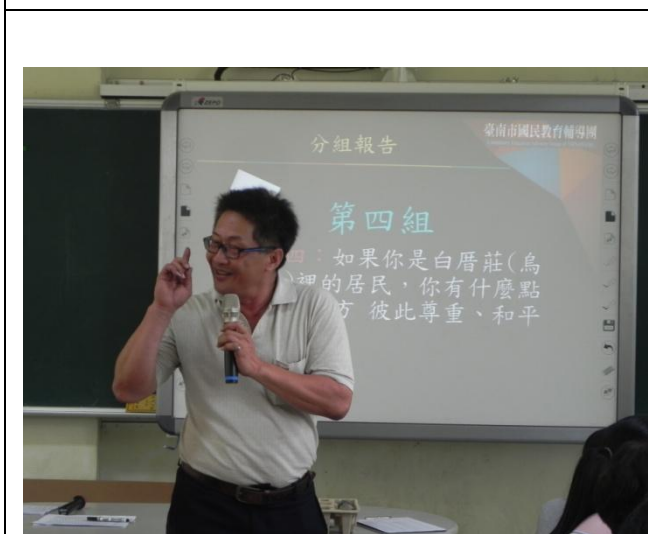
分組討論進行發表