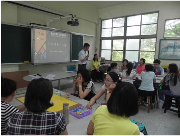
三和校長擔任引言，並說明世界人權日活動及教學包下載方式