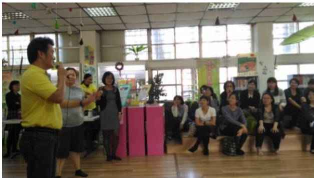
利用行動劇來進行漫畫定格的推演遊戲