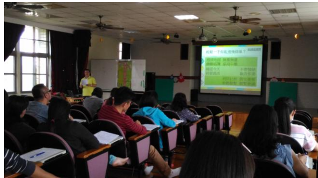
讓學員回憶或猜測劇情的演變