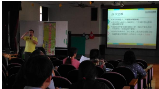
瑞隆老師以不同時期的漫畫來講解人權議題 在生活中被重視的程度及演變