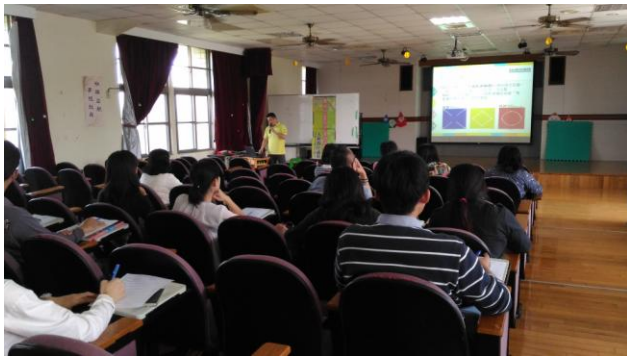
講解過程引用圖片及影片