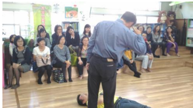
利用行動劇來進行漫畫定格的推演遊戲