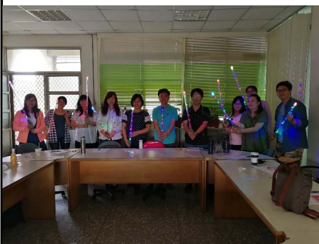
相片說明：光劍製作3