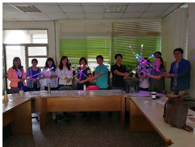
相片說明：光劍製作4