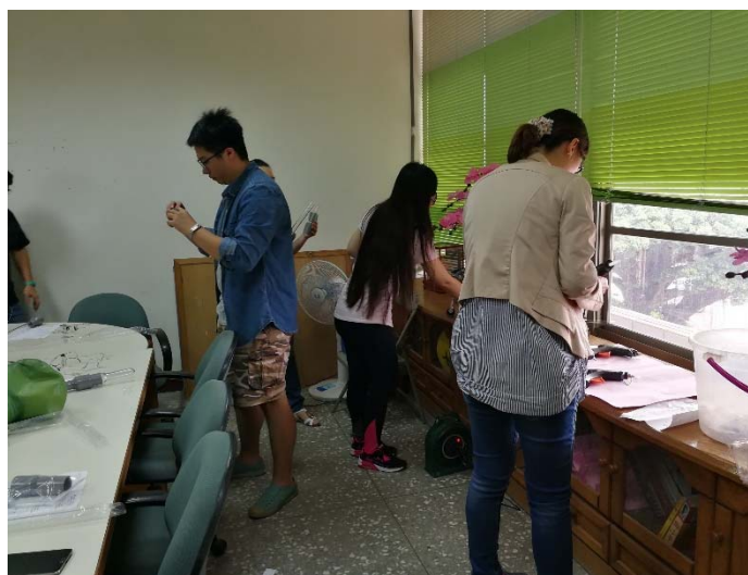
相片說明：光劍製作2