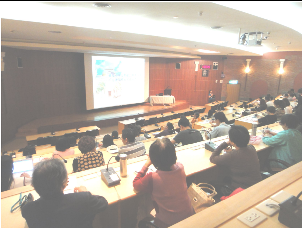
台文館講座活動說明