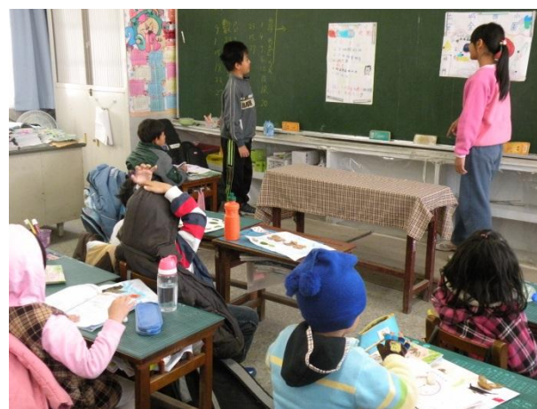
活動四：「小行動大安全」到一年級宣導情形