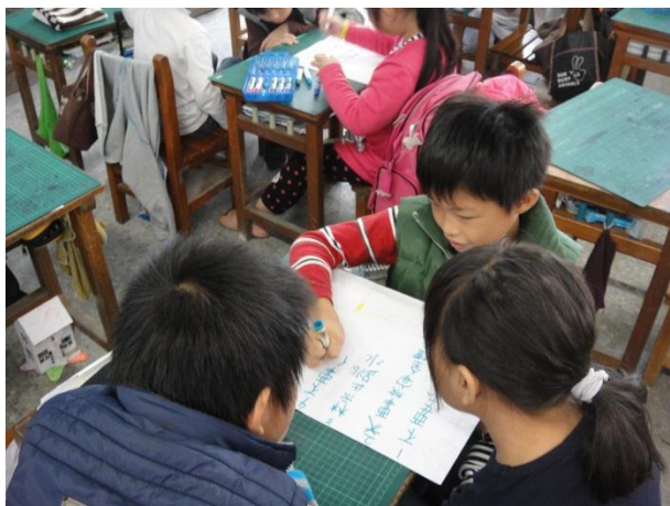
活動三：「校園潛在危險大進擊」分組討論情形