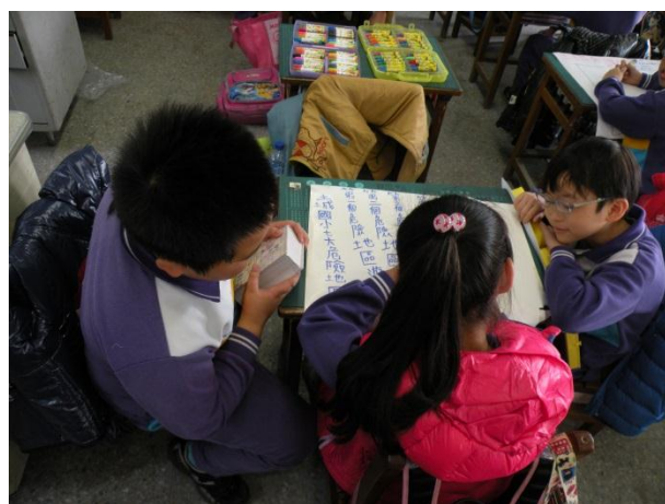
活動四：「小行動大安全」分組製作海報、警告標示情形