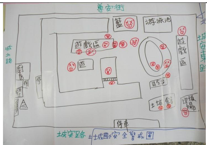
活動一：「繪製安全地圖」全班共同繪製的安全警戒圖