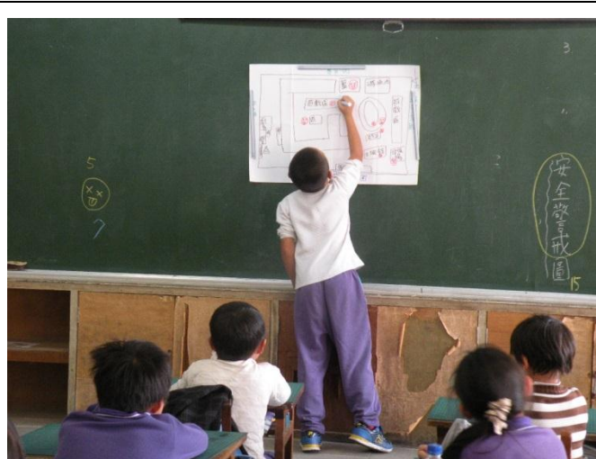
活動一：「繪製安全地圖」上學上台分享、繪製地圖的情形