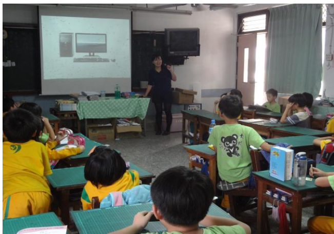
播放記憶力大挑戰 PPT