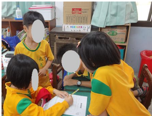
小組合作完成學習單