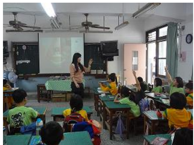
講述南瓜湯繪本故事