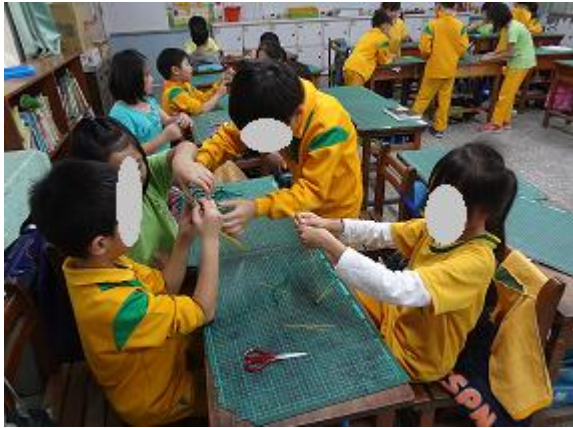
小組合作進行 QQ 糖挑戰