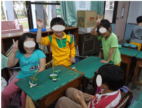
小組合作達成 QQ 糖挑戰