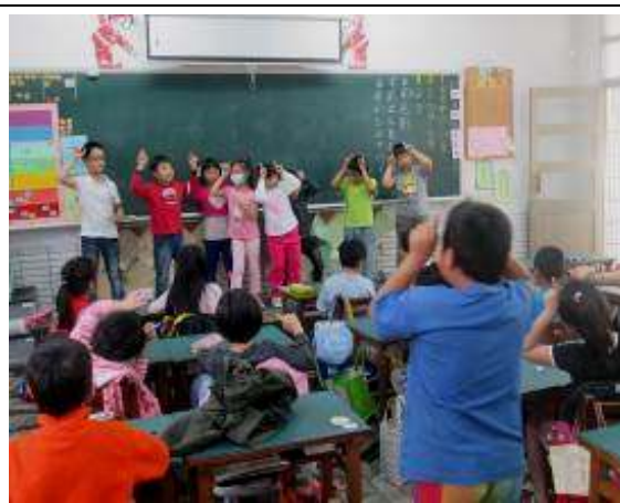
課文歌曲舞蹈動作編創活動，以及熟練動作後的小組舞蹈競賽。