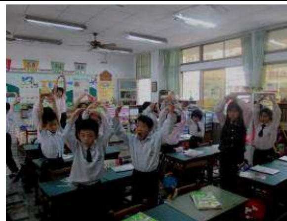
「○×遊戲」——測驗課文理解。