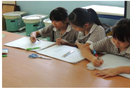
說明:學生構圖文旦寶寶造型