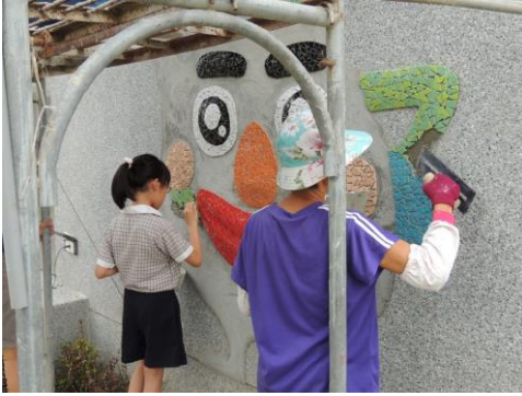
說明:動手參與新建圖書館馬賽克拼貼