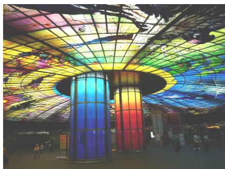
高雄捷運美麗島站 光之穹頂 媒材：玻璃