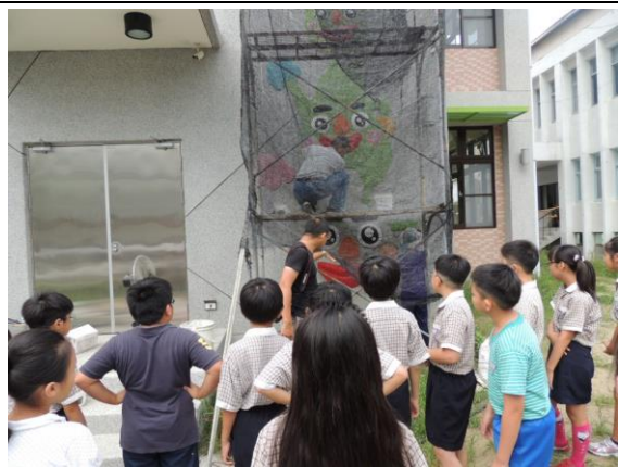
說明:大家一起來看看圍牆馬賽克進度