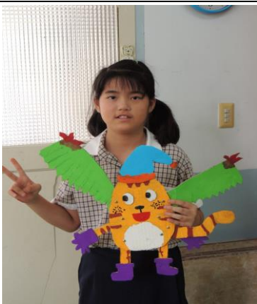
說明:完成自己設計的文旦寶寶