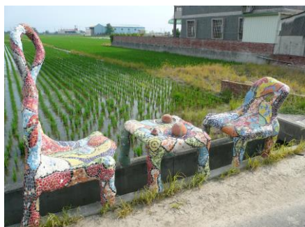
土溝村社區總體營造 公共藝術： 十分鐘的陶淵明 媒材：馬賽克磁磚