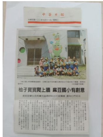
說明:我們的公共藝術文旦寶寶上報紙囉!