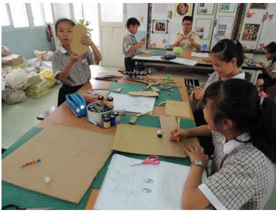
說明:利用紙板裁剪文旦寶寶外型