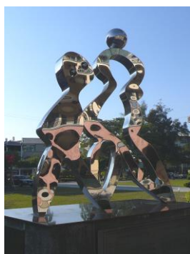
麻豆國小 源。根 媒材：不銹鋼