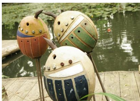
台北市立 大直高級中學 心靈之鳥 媒材：陶土、釉藥