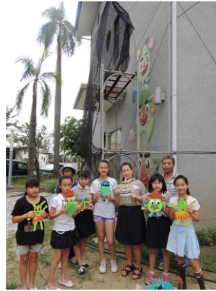
說明:秀出我們的設計圖