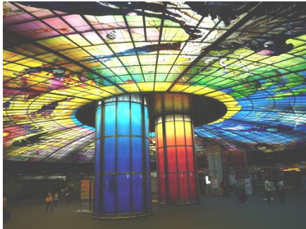
高雄捷運 美麗島站 光之穹頂