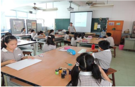
說明:介紹公共藝術及文旦寶寶設計