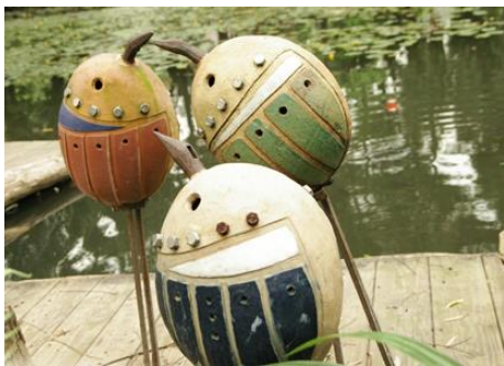
台北市 立大直 高級中 學