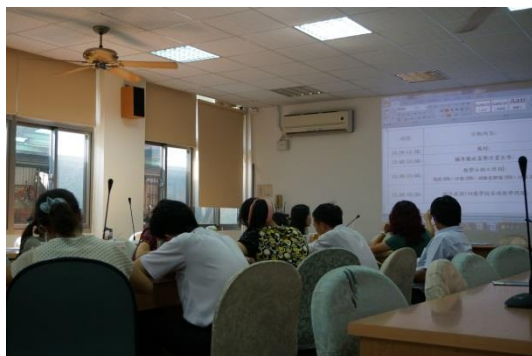
到校諮詢方式研討