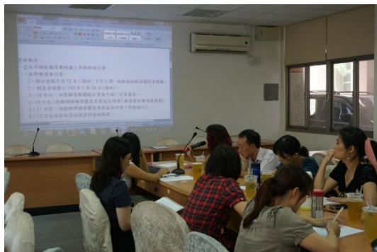
本學期輔導團重要事宜佈達