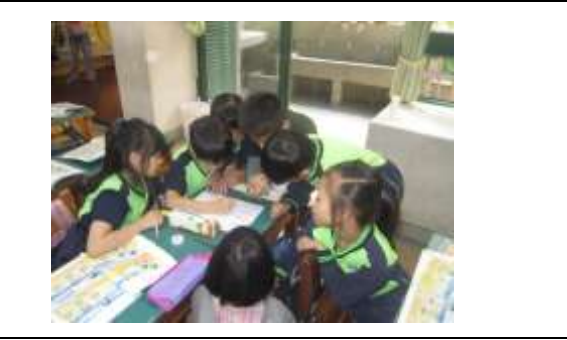
Role play 同儕評量