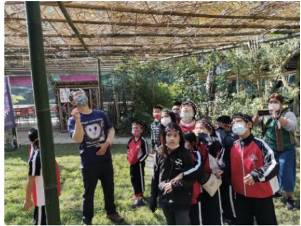
口埤實小與霧台國小兩校學生舉行生態文化共學。